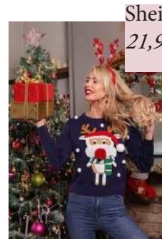
Shein - Pull à motif dessin animé avec ponpons ! 21,99 euros

Noël approche à grands pas. La magie vient s'immiscer à l'intérieur des maisons illuminées. Les sapins, décorés de guirlandes, de boules et d'étoiles scintillantes, n'attendent plus que les cadeaux soigneusement emballés. Le chocolat chaud entre les mains, le plaid sur les genoux, la cheminée allumée... Le mood « Christmas » est au rendez-vous. Mais quoi de mieux qu'un pull de Noël pour se mettre dans l'esprit des fêtes ? Voici notre sélection, c'est cadeau !