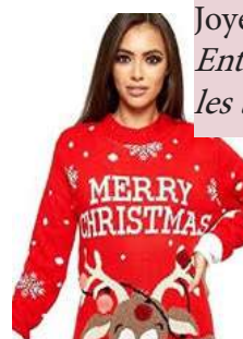
Amazon - Femmes Tricoté Joyeux Noël Entre 6,73 et 24, 65 euros selon les tailles