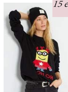
Kiabi - Pull de Noël 'Minions' 15 euros