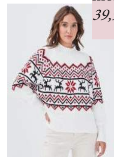
Cache Cache - Pull Noël avec col montant 39,99 euros