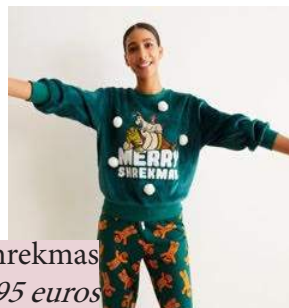
Undiz - Pull merry shrekmas 24,95 euros