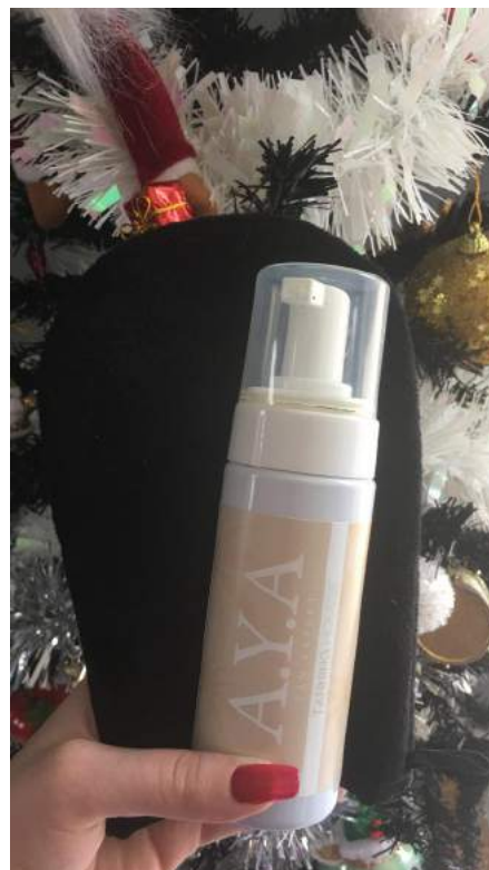
Le kit flacon + gant - 39.90€

Cet autobronzant résiste à l'eau et il a une formule hydratante et vegan à 90% d'origine naturelle.