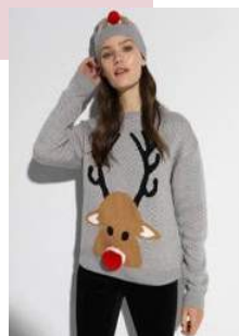
La Redoute - Pull avec renne et bonnet 29,99 euros